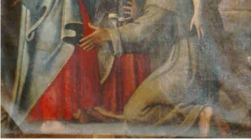
Tela del Carracci: "Il perdono di Assisi"

tu do- da par- al pon- ta con azione. o, per dulgèn- e San- me". E